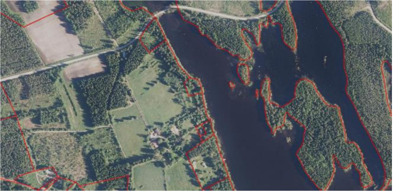
Kuva 6. Ilmakuva alueelta.