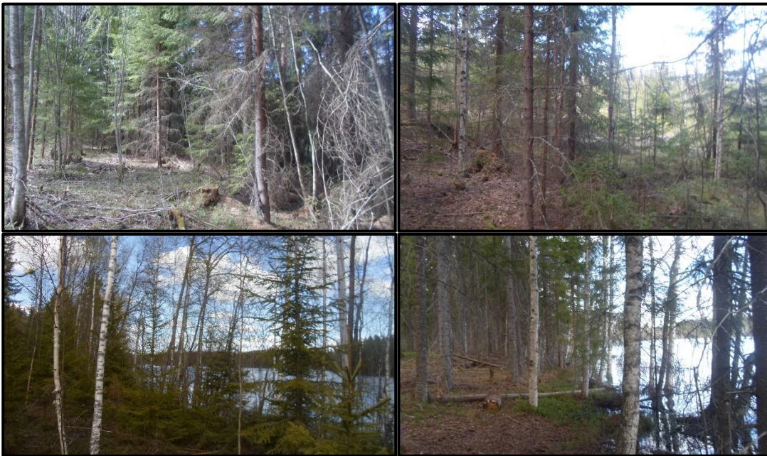
Kuva 2abc. Tyypillistä kasvillisuutta suunnittelualueen pohjoisosassa. Puusto on kuusivaltaista

Ensimmäiseksi maastossa inventoitiin Päälahden puoleinen ranta-alue. Sillan läheisyydessä on tulvivaa rantaa inventointiajankohtana, mutta se lienee vain satunnaista. Muuten puusto sillalta pohjoiseen kuljettaessa on pääosin kuusimäntyvaltaista sekapuustoa, joka on talousmetsäkäytössä.