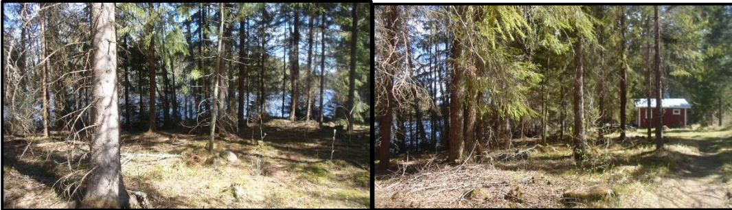
Kuvat 4ab. Eteläosan laidunalueen ulkopuolella on järeää kuusikkoa. Puusto on lähinnä lehtomaista kangasta. Eräät kuuset ovat todella järeitä.

Sillan eteläpuolinen alue on pääosin hevoslaidunta. Pohjoisosa on laidunalueen ulkopuolella lehtomaista tai tuoretta kuusikangasta: isotalvikki, käenkaali, mansikka, oravanmarja, metsätähti, karhunputki, metsälvejuuri, vadelma jne. Varsinaisella laidunalueella on mm. metsälauhaa, lampaannataa, jäkkiä, ahomansikkaa, rohtotädykettä ja niittyhumalaa. Tyypillisiä ovat myös nurmirölli, ahomatara, valkovuokko, metsäapila, metsäkastikka, nurmilauha, poimulehdet, pukinjuuri, sananjalka, nurmitädyke, aitovirna, kurjenkello, virnasara, ruusuruoho, kullero, valkovuokko, oravanmarja, puolukka, mustaherukka, metsäkastikka, käenkaali, mustikka, metsälauha ja oravanmarja. Muita metsälaitumilla tyypillisesti tavattavia lajeja ovat ahomansikka, nurmitädyke, poimulehdet, kalvassara, lehtokuusama, taikinamarja, herukat, ruusuruoho ja kullero, mansikka, käenkaalta oravanmarjaa, nokkosta, vadelmaa, karhunputkea, sudenmarjaa, niittytädykettä. Rantavyöhykkeessä on todella järeitä kuusia.